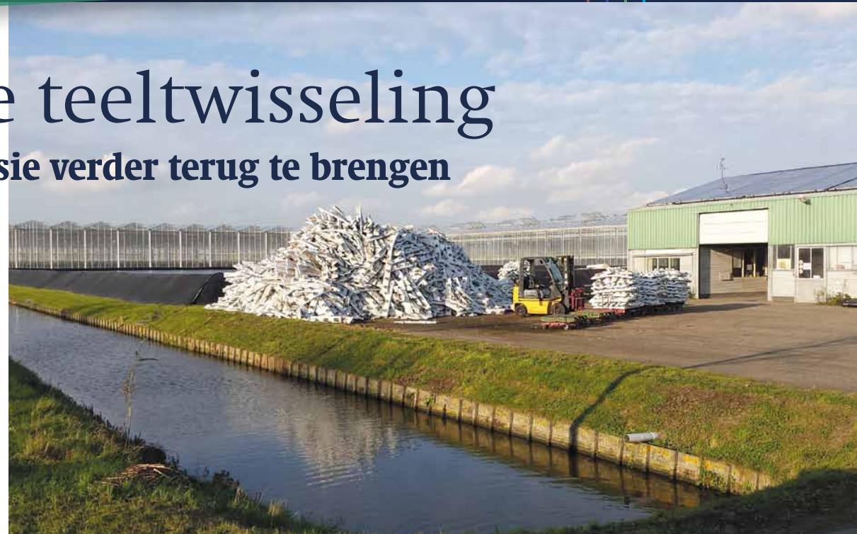
De beëindiging van een teelt is doorgaans meteen een 'grote schoonmaak'. Op de foto gebruikte teeltmatten.