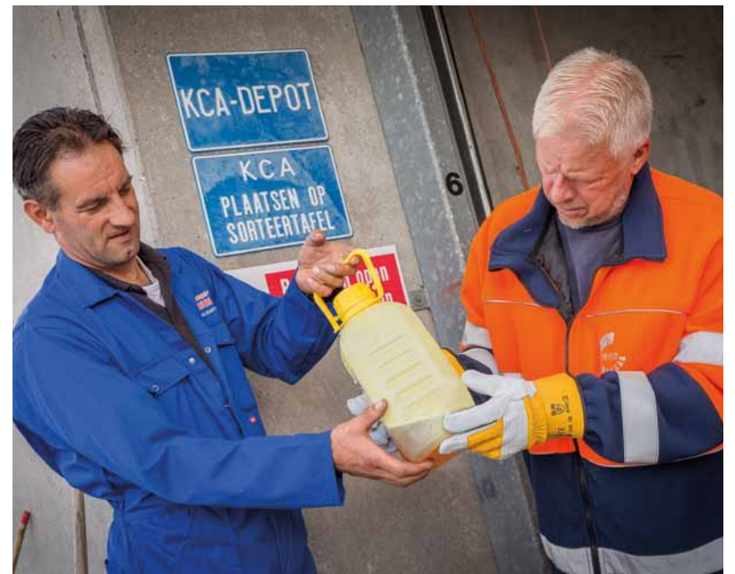
Gemeenten ontvangen van de gewasbeschermingsbedrijven een vergoeding voor het innemen van lege verpakkingen en restanten van gewasbeschermingsmiddelen.

De verstrekte vergoedingen worden gefinancierd door de bedrijven die gewasbeschermingsmiddelen op de Nederlandse markt brengen. Dat zijn voornamelijk de bij Nefyto aangesloten bedrijven, maar ook een aantal andere toelatinghouders.