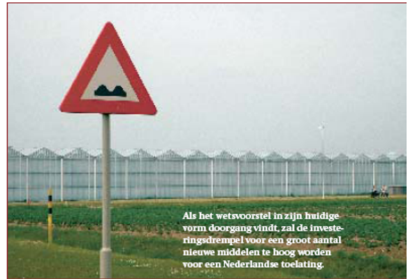
Als het wetsvoorstel in zijn huidige vorm doorgang vindt, zal de investeringsdrempel voor een groot aantal nieuwe middelen te hoog worden voor een Nederlandse toelating.

Daar komt bij dat de behandelingskosten van een ingediende zienswijze voor rekening komen voor de toelatingsaanvrager. En dus bovenop de toch al hoge aanvraagkosten komen. Nefyto vindt dit niet acceptabel. Bovendien biedt de regeling derden de mogelijkheid om inzage te krijgen in de zakelijke inhoud van het concept-besluit. Ook kunnen zij vragen om inzage in de studies. Dat legt grotere druk op de